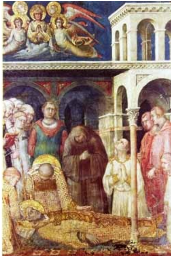
Mort de Saint Martin.

Après bien des péripéties pour savoir où sa dépouille allait reposer, ses obsèques ont lieu le 11 novembre et son tombeau est actuellement abrité par la basilique Saint